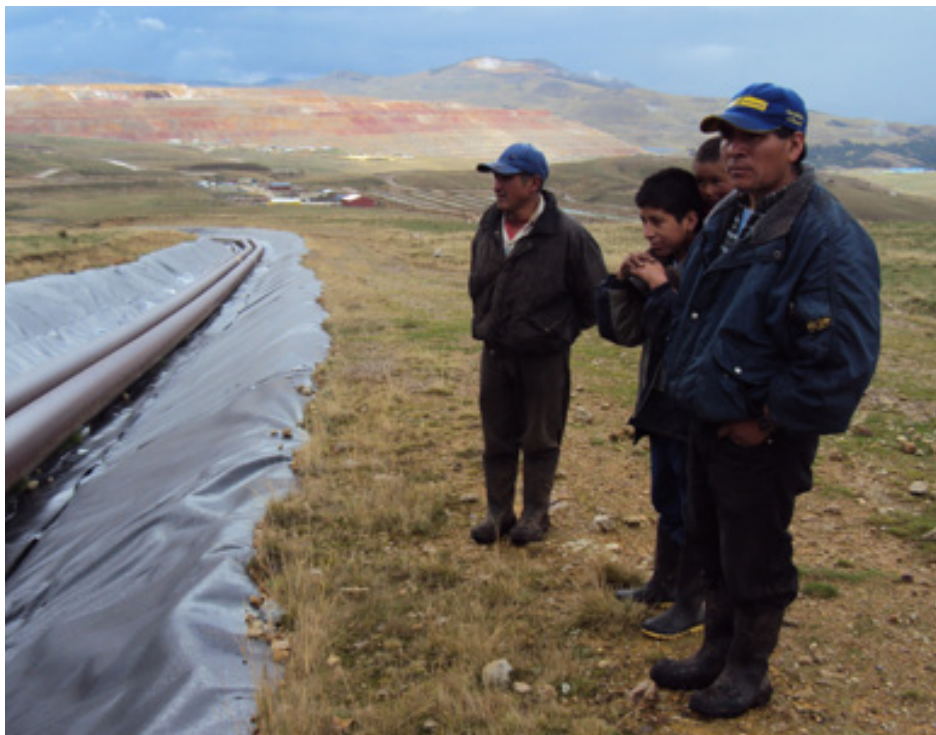
Les populations andines sont lassées de subir les impacts négatifs de l'extraction minière. Elles ont décidé de protester pacifiquement.

Commission Justice et Paix Belgique francophone