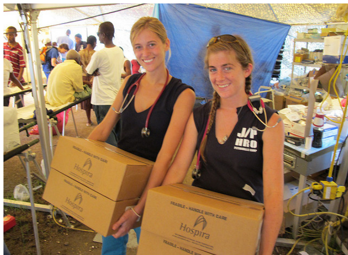
Volontaires à Haïti après le tremblement de terre de 2010.

Nous avons tant été abreuvés d'images de destruction et d'impuissance d'abord, de secouristes, militaires et humanitaires internationaux ensuite, qu'on en avait presque oublié qu'il y avait là un peuple, actif et réactif, qui n'était pas condamné ou réduit à être «le réceptacle d'une humanité souffrante, en attente d'être sauvée par l'humanitarisme occidental» 2 .